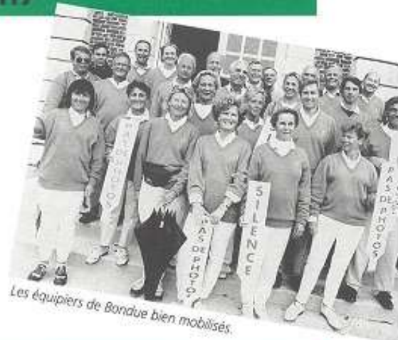
Les équipiers de Bondue bien mobilisés.

Golf de Bondues - 59910 BONDUES - HAWTREE Par 71 - Longueur : 6.270 mètres (le trou n° 1 est compté Par 4).