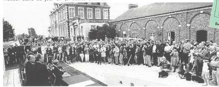
Remise des Prix