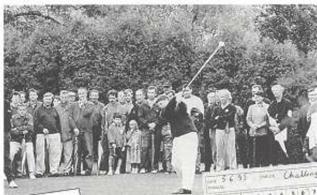
Carte de score MUTZ 4 ème T