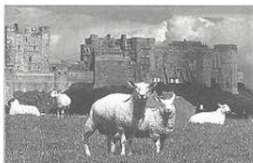
Les châteaux de la guerre... et de paisibles tondeuses.

Tandis qu'en Hollande le golf s'épuise ou évolue vers le golf-court, essentiellement parce que la nature ne se prête pas spontanément au grand jeu, en Ecosse le terrain est parfaitement adapté à celui-ci, avec les landes herbeuses le long de la mer à proximité des villes.