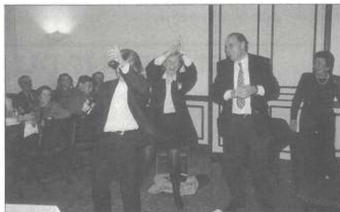
C'est tous ensemble que nous rendons vivant et convivial notre Club House (photos soirée du 5 février).