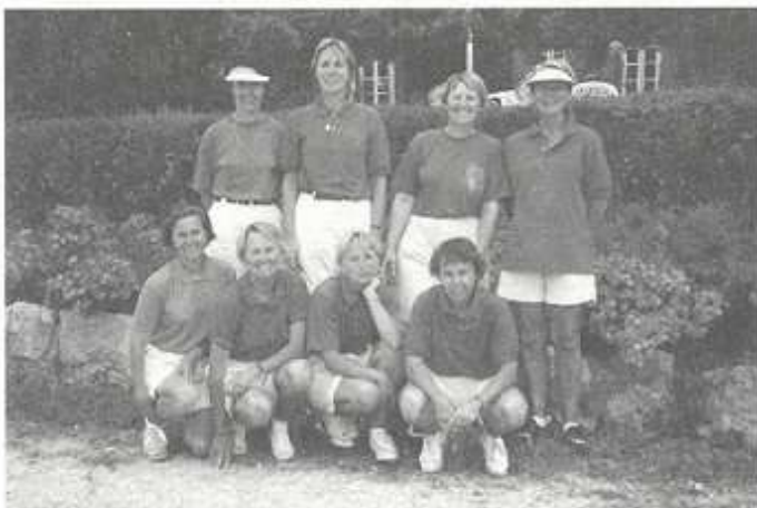
Équipe de " Commission Féminine " 1992 à Aix-Marseille.

Garniste - Fabricant - Installateur Sur 6000 m 2