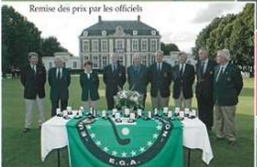
Remise des prix par les officiels