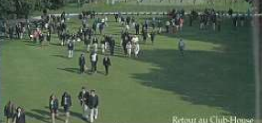
Retour au Club-House

Plusieurs membres m'ayant demandé quelques éclaircissements sur l'organisation de la compétition, je vais essayer d'en expliquer le fonctionnement le plus clairement possible.