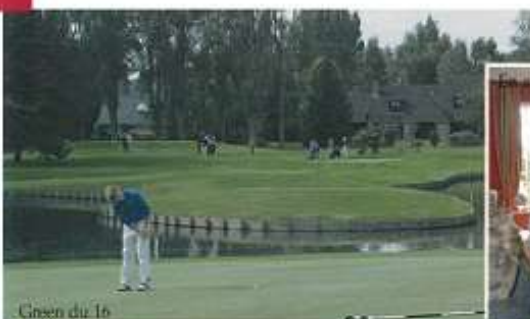
Grien du 16