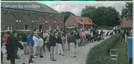
Devant les résultats