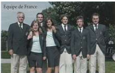
Equipe de France

Pour notre club, ce fut une semaine privilégiée. Les spectateurs, de plus en plus nombreux, ont pu admirer du golf à haut niveau et profiter d'une ambiance jeune et conviviale.