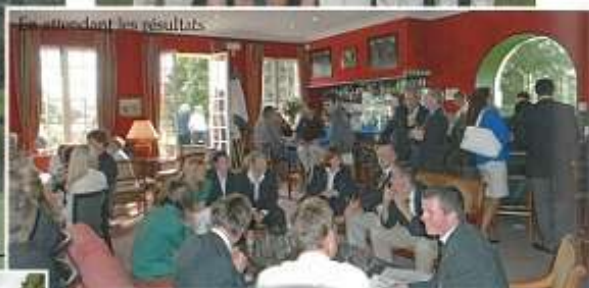
Présentation des résultats