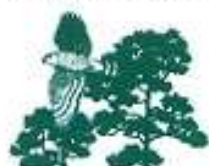
Autour des Palombes

... Un matin, je l'entends siffler et le vois sur une branche haute de pin. Je le reverrai au même endroit presque tous les matins pendant une dizaine de jours. J'ai pris deux photos : il s'agit d'Autours des Palombes.