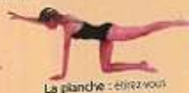
La planche : étirez-vous