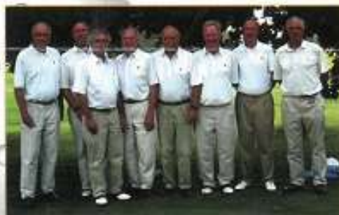
Equipe 2003 Seniors de Bondues (2e division Nationale)