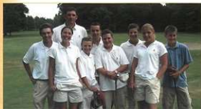
Equipe 2003 de l'Orangina Ball (Championnat de France Jeunes par équipes)