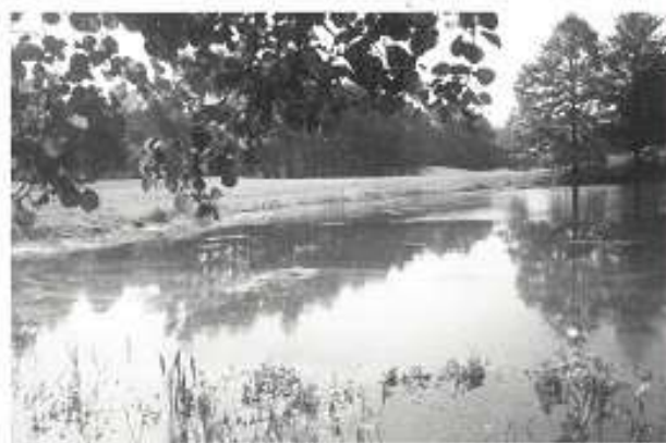
Hawtree Green du 11

Il crache à nouveau, se relève, réajuste sa musette et reprend sa route, tout droit. "J'vas m'pendre !"