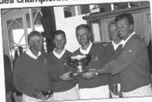
L'équipe de Bondues a rivalisé de régularité et de précision, se permettant au passage de battre l'équipe de Rennes représentant le Bretagne.