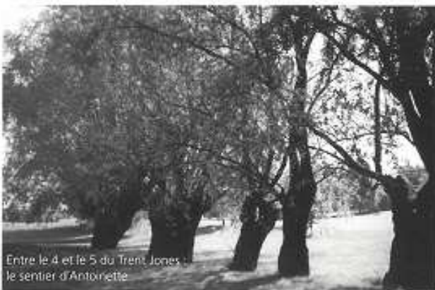
Entre le 4 et le 5 du Trent Jones le sentier d'Antoinette

- « Chaque fois que la lune, qui commande aux femmes comme elle commande à la terre, tonna le Juge, chaque fois que la lune sera dans son plein, tu t'en iras par les chemins, égrenant tes peines pour en saisir la perversité ! »