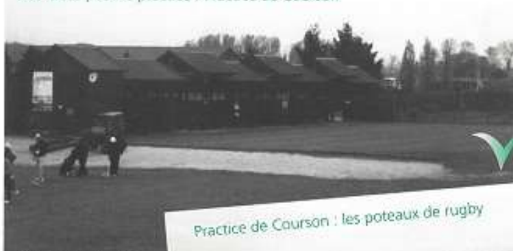
Practice de Courson : les poteaux de rugby