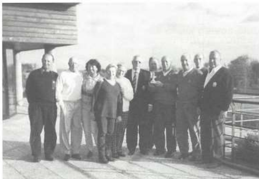
Equipes de Bondues au Golf de Saint-Omer lors de la remise des coupes du C.I.S. le 26 octobre