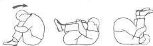
Etirement des muscles postérieurs de la hanche