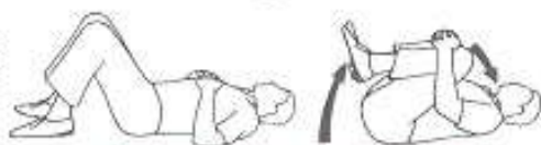
Etirement des muscles paravertébraux