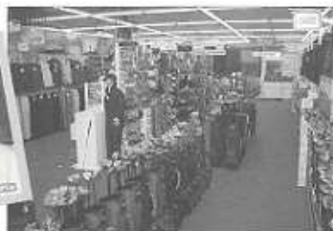
Le Rayon Golf chez DECATHLON est présent à Villeneuve d'Ascq et aussi à Rancq.