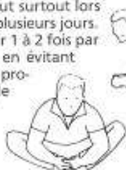
Etirement des adducteurs et des muscles de la région lombaire