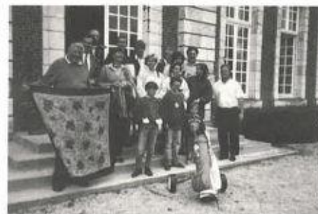
Les non classés avant gagnant de bonne huc.

Encore bravo à tous ceux qui ont fait des progrès cette saison !